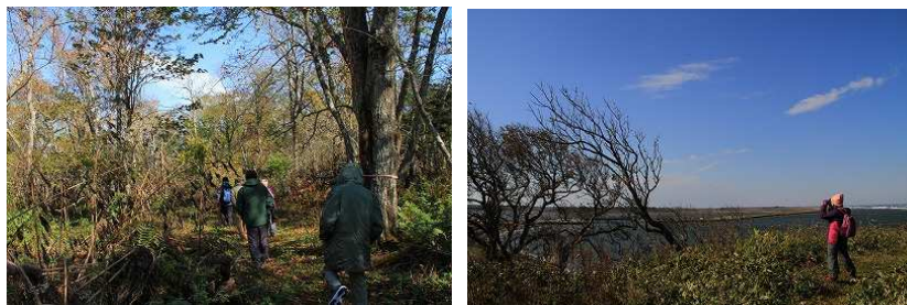
2016年第5週 東梅自然学習林