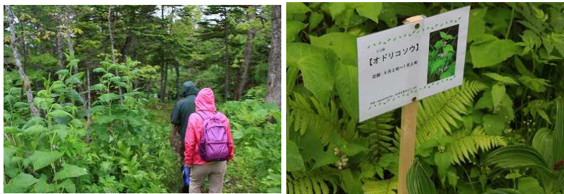
2016年第1週 東梅自然学習林