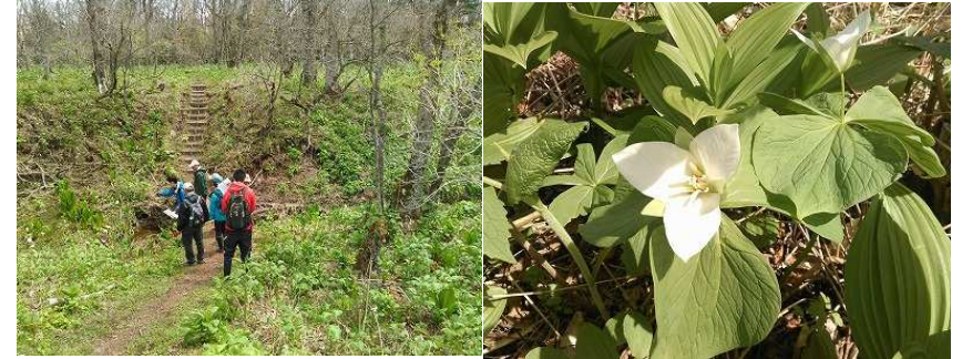
2016年第2週 東梅自然学習林