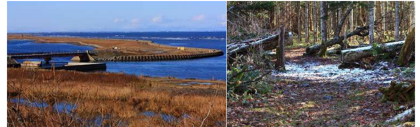
2012年第4週 春国岱・東梅自然学習林