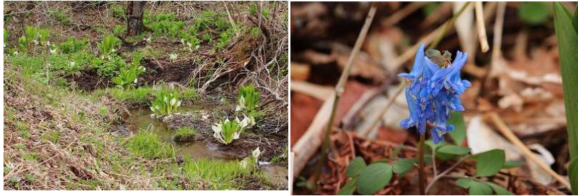
2012年第2週 東梅自然学習林