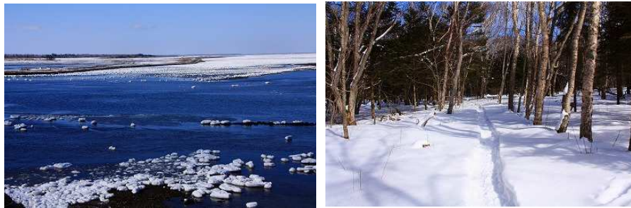
2015年第3週 東梅自然学習林