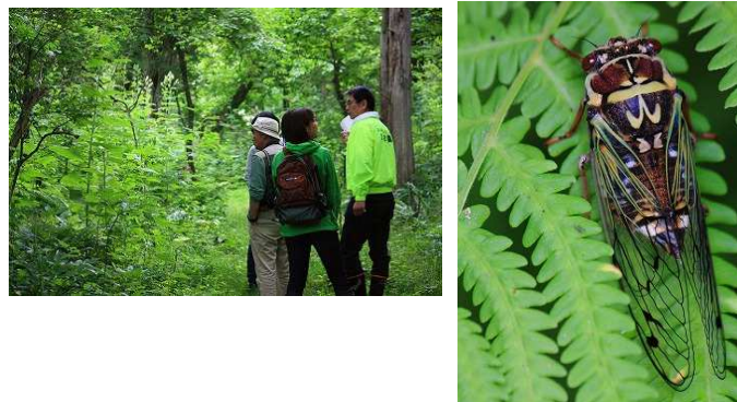
2013年第3週 東梅自然学習林