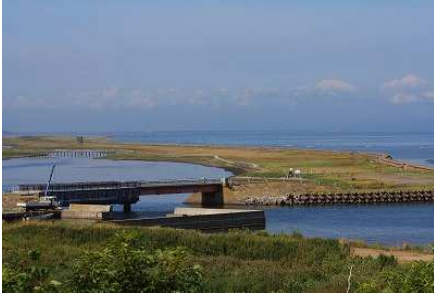
2012年第2週 春国岱・東梅自然学習林