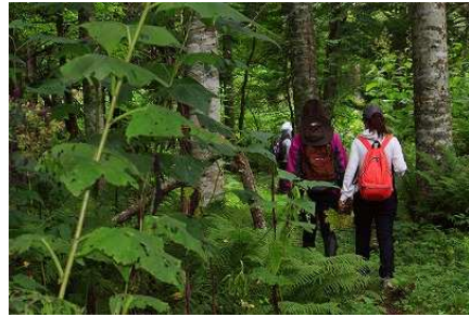
2013年第3週 東梅自然学習林