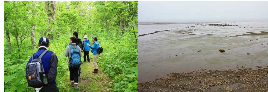
2015年第3週 東梅自然学習林