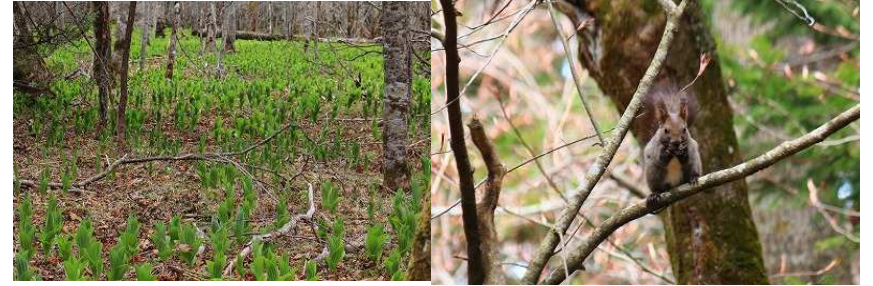
2013年第2週 東梅学習林