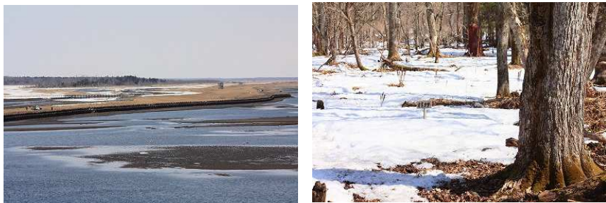
2013年第4週 東梅自然学習林