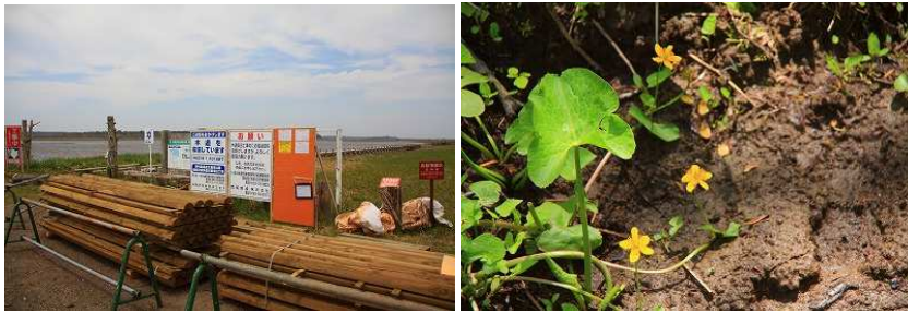
2015年第4週 春国岱・東梅自然学習林