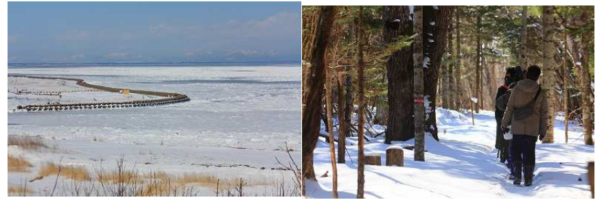
2013年第4週 東梅自然学習林