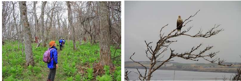
2017年第2週 東梅自然学習林