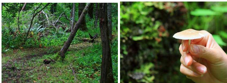
2012年第3週 東梅自然学習林