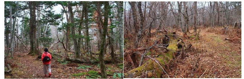
2014年第5週 東梅自然学習林