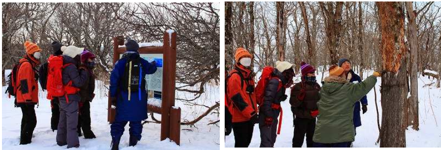
2012年第1週 東梅自然学習林