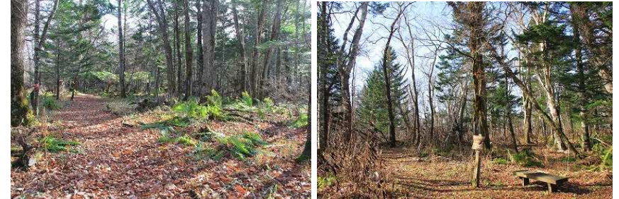
2017年第2週 東梅自然学習林