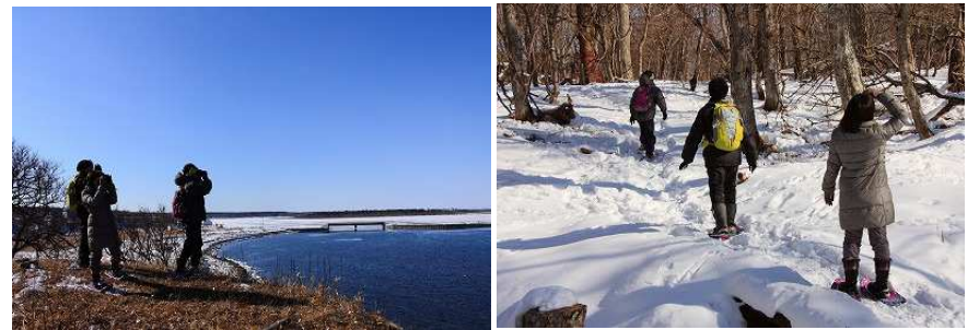
2016年第1週 東梅自然学習林