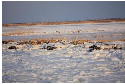
【参考画像】 2012年第2週 春国岱