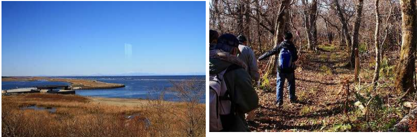
2013年第2週 春国岱・東梅自然学習林